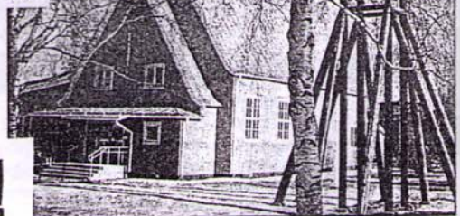
Krokom kyrka och klockstapel.