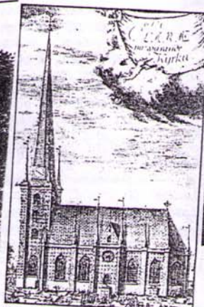
S:t Clara kyrka 1727. Till det yttre är kyrkan densamma i dag.